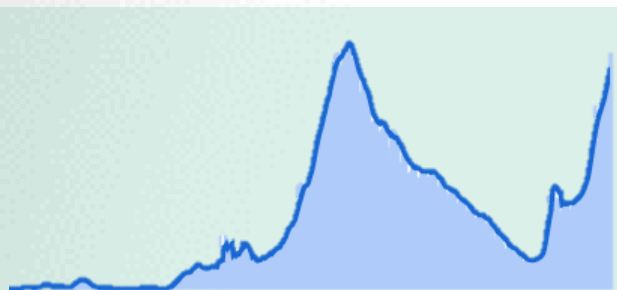
แสดงจำนวนผู้ติดเชื้อรายใหม่ ย้อนหลัง 1 ปี