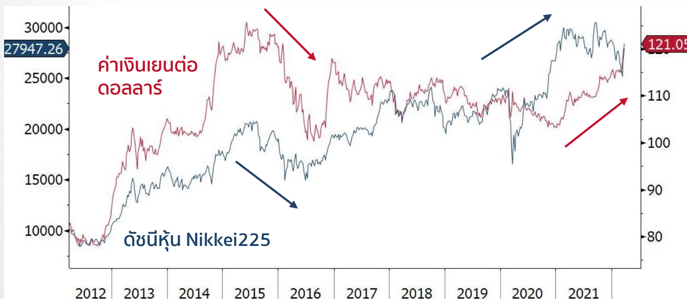
ดัชนีหุ้น Nikkei225 และ ค่าเงินเยนต่อดอลลาร์